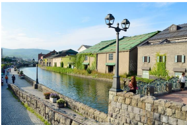
Cコース：小樽運河（小樽市）