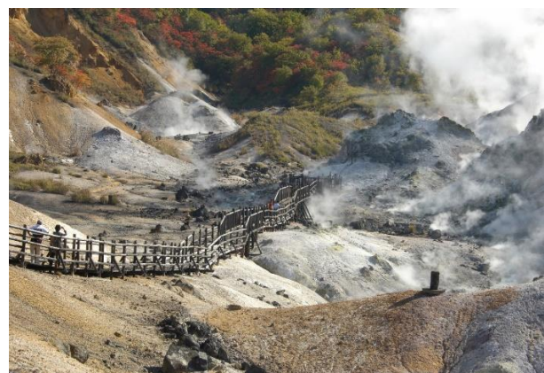
Dコース：地獄谷（登別市）