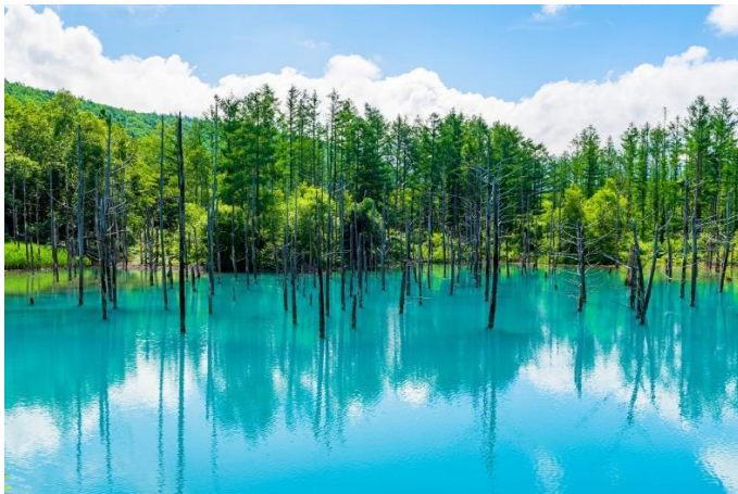
A・Bコース：青い池（美瑛町）